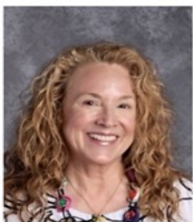
Mrs. Bernards Success Academy